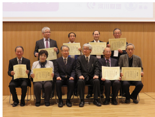
表彰状を受け取る(岩崎事務局長:後列右から2番目)